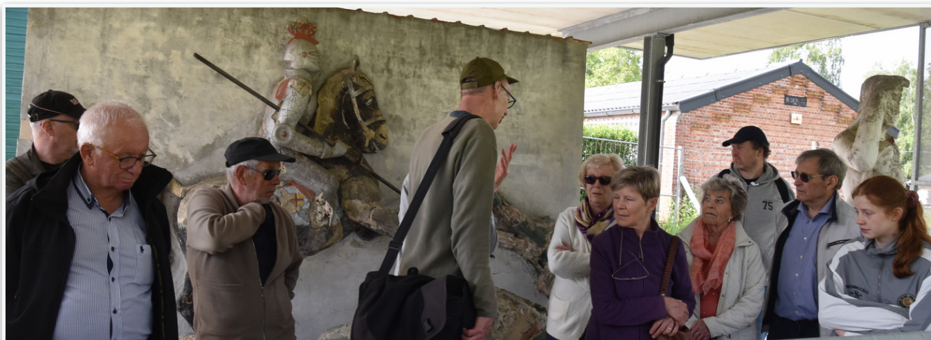
De gids vertelde ons op een deskundige manier over de rijke oorlogsverleden, voornamelijk als krijgsgevangenen kamp en de natuur in het afgesloten stille gebied van dit domein.