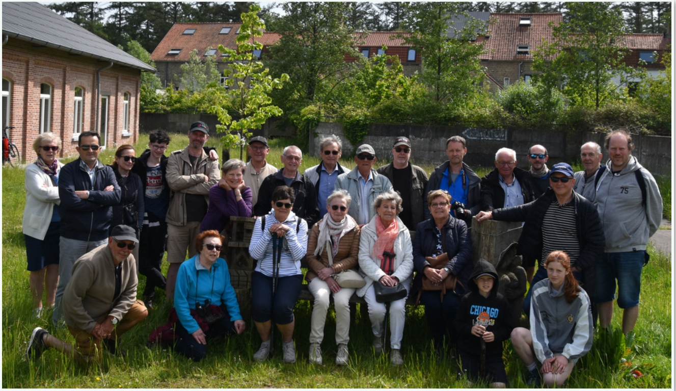
Groepsfoto van onze Nikei spelers in het Vloethemveld